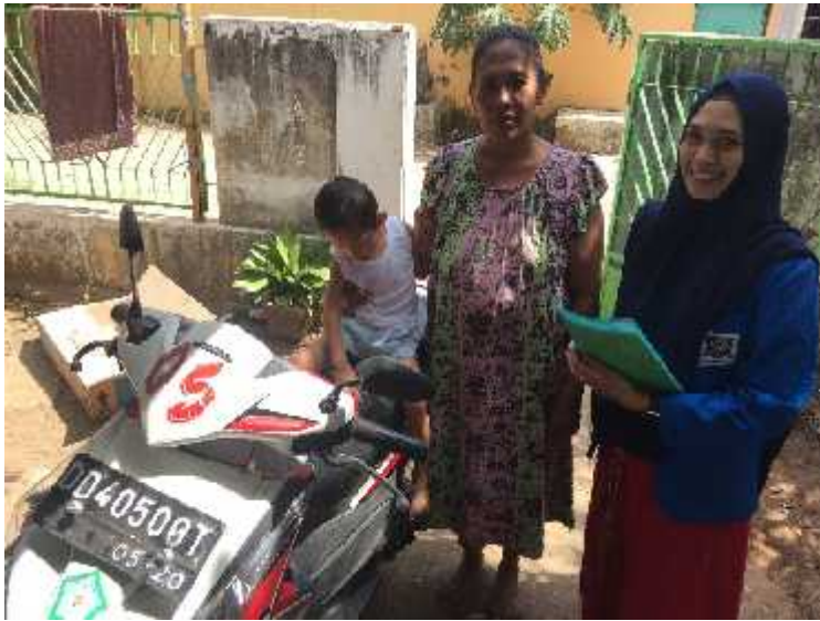
DOKUMENTASI WAWANCARA TANGGAL 23 JULI 2017