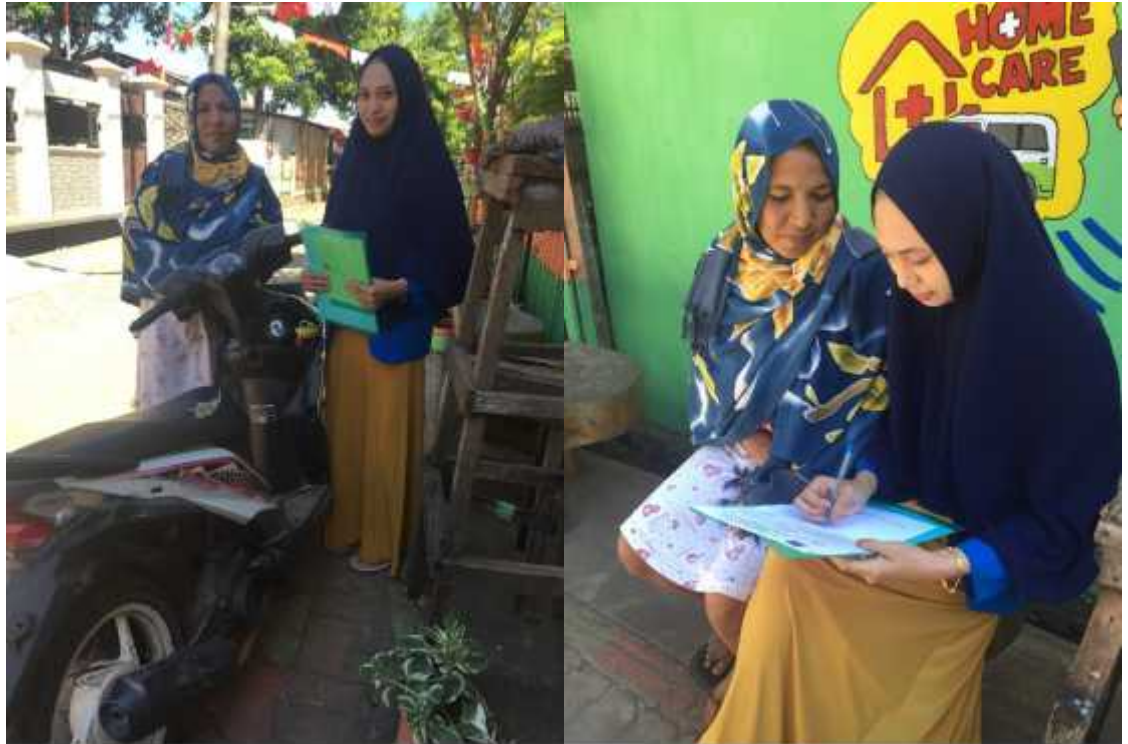
DOKUMENTASI WAWANCARA TANGGAL 23 JULI 2017