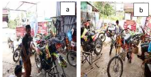
Gambar 3. Elektronik Control Unit (ECU).; a) Motor sebelum perawatan; b) Beberapa motor setelah perawatan dengan metode ECU

Banyaknya konsumen yang berdatangan dalam pelayanan metode ECU mulai tidak menentu seperti saat ini, hal ini dipicu oleh pelayanan yang cepat, hasil diagnosis kerusakan tepat, sehingga instrument dan tindakan yang akan digunakan juga lebih cepat. Usaha bengkel ini mulai mengalami kesulitan. Proses perbaikan yang biasanya dapat dilakukan dalam waktu yang relative singkat, yaitu 2 jam untuk motor injeksi yang mengalami masalah kecil, menjadi lebih lama lagi, yaitu 3-4 jam karena banyaknya penggunaan motor injeksi