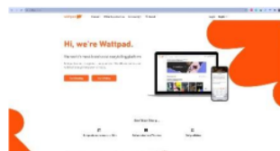
Gambar 2. Wattpad Situs

Sebelum memulai penelitian, peneliti menyusun kuesioner pra-uji yang bertujuan untuk mengumpulkan data dengan indikator jangkauan pengetahuan sampel terkait ilmu sastra secara awam. Kuesioner tersebut berisikan 13 poin pertanyaan yang telah disusun dengan indikator sebagai berikut: 1) bertujuan mengetahui tingkat pengetahuan sampel terkait ilmu sastra secara awam; 2) untuk mengetahui pendapat sampel terkait ilmu sastra; dan 3) tingkat ketertarikan sampel terhadap ilmu sastra.