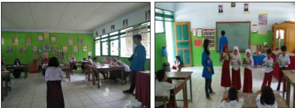
Gambar 2. Tahap Evaluasi

Berdasarkan hasil post-test yang telah diperoleh dapat ditarik kesimpulan bahwasanya masih berada pada kategori Baik . Nilai rata-rata terendah pada post-test ini adalah 70.3 sedangkan yang tertinggi adalah 75. Hasil ini jika dibandingkan pada pre-test mengalami kemajuan yang bisa dikatakan cukup signifikan terlihat pada kenaikan sebanyak 3% . Angka ini menunjukkan bahwa ada kemajuan dari sebelum dan setelah proses pembelajaran. Nilai tersebut adalah, 64.3 (satu orang) untuk nilai terendah dan 73 (satu orang) untuk nilai tertinggi.