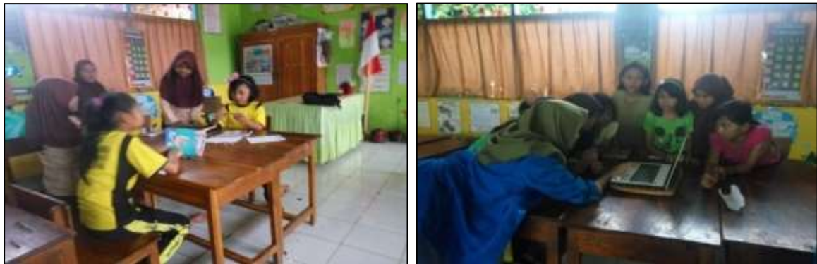
Gambar 1. Situasi Belajar

Selanjutnya, proses pembelajaran diterapkan dengan memberikan buku bergambar ataupun gambar-gambar yang anak-anak dapat nikmati melalui laptop. Sesi ini dilakukan dengan memperkenalkan kepada anak-anak mengenai kosakata dasar ( vocabulary ) yang bertemakan alam. Langkah yang dilakukan pertama adalah, menunjukkan ilustrasi cerita kepada siswa yang terdapat pada laptop. Setelah itu, tim kemudian menuntun siswa untuk menyebutkan hal yang mereka lihat di buku bergambar. Jika siswa kesulitan, maka tim kemudian membantu untuk mengarahkan mereka menyebutkan apa yang mereka lihat. Benda-benda yang mereka lihat adalah segala benda yang memiliki kaitan dengan kebersihan lingkungan.